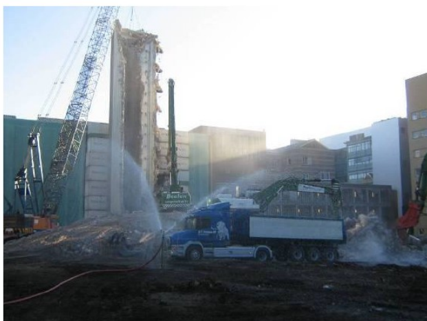
Sectorsproeier tijdens het laden van puin

Overlast willen we zoveel mogelijk beperken door bijvoorbeeld inzet van een betonschaar, waardoor we secuur kunnen werken en er zo min mogelijk grote delen naar beneden vallen, instructies aan alle chauffeurs en gebruik van een sproeisysteem op de kraan om stofoverlast te beperken.