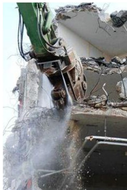
Sproeisysteem op kraan