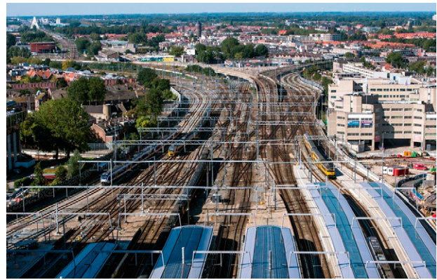
Vernieuwing van sporen en perrons Utrecht Centraal

In 2016 worden er perronkappen vernieuwd en verbreed. Zowel aan de noord- als aan de zuidzijde van het station worden er sporen vernieuwd en in rechte banen gelegd. De zuidelijke sporen worden aangesloten op de sporen tussen Utrecht