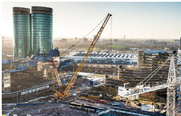
Bouwplaats van de Moreelsebrug aan de kant van Croeselaan

buiten de normale werktijden te verwachten. Meer info over de werkzaamheden staat in de wekelijkse nieuwsbrief van BAM SPO. Aanmelden kan via info@bam-spo.nl .