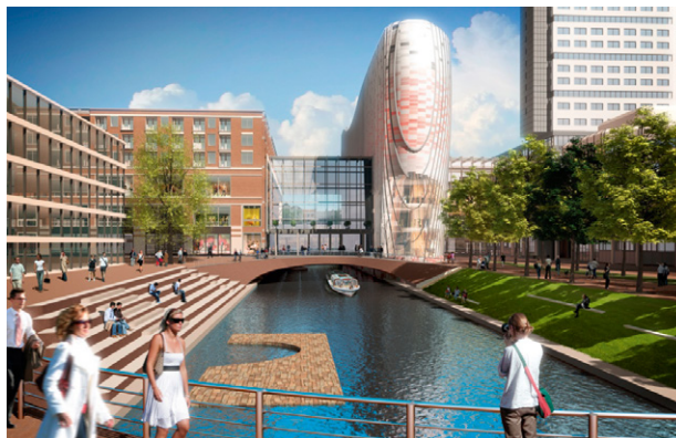
vlnr: Entreegebouw - Stadskamer - Poortgebouw - Bruggebouw - Hoog Catharijne met Radboudveste erboven

Ook is begonnen met de fundering van het Bruggebouw van Hoog Catharijne. Het werkterrein is te zien wanneer je vanuit de Stationsstraat rechts de Catharijnesingel opdraait. Er wordt gewerkt met zwaar materieel voor het heikwerk en de fundering. Omdat de werkzaamheden dicht tegen het gebouw van Hoog Catharijne aan plaatsvinden, kan dit aan de voorzijde (met zicht op de werkzaamhe-