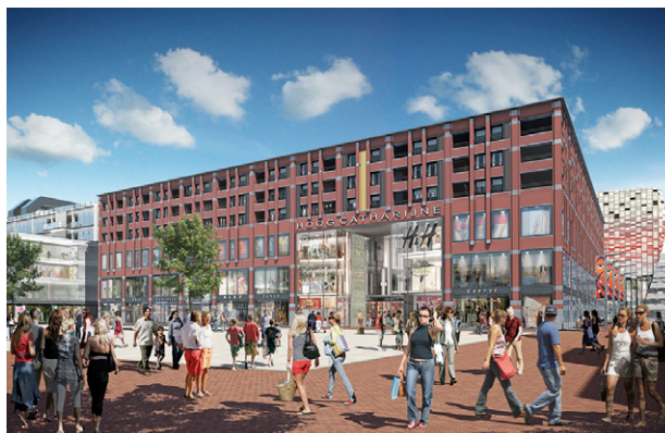
Entreegebouw gezien vanaf Vredenburgplein

Medio 2016 kunnen de eerste bezoekers parkeren in de nieuwe Vredenburggarage, die vijf ondergrondse verdiepingen en 1300 parkeerplaatsen heeft.