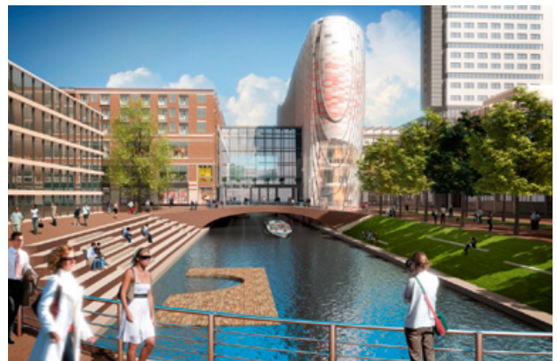
Vlnr: Entreegebouw - Stadskamer - Poortgebouw - Bruggebouw - Hoog Catharijne met Radboudveste erboven

Sinds 2009 werkt Klepierre aan de vernieuwing van Hoog Catharijne. In 2012 werden woonwinkelgebouw de Vredenburg en de nieuwe passage Singelborch geopend. In 2016 wordt verder gewerkt aan de bouw van twee nieuwe entrees aan het Vredenburgplein, waarvan de eerste naar verwachting binnen een jaar open gaat. Ook is begonnen met de fundering van het Bruggebouw van Hoog Catharijne. Het werkterrein is te zien wanneer je vanuit de Stationsstraat rechts de Catharijnesingel opdraait. Er wordt gewerkt met zwaar materieel voor het heiwerk en de fundering. Omdat de werkzaamheden dicht tegen het gebouw van Hoog Catharijne aan plaatsvinden, kan dit aan de voorzijde (met zicht op de werkzaamheden van de parkeergarage Vredenburg) overlast/geluid veroorzaken.