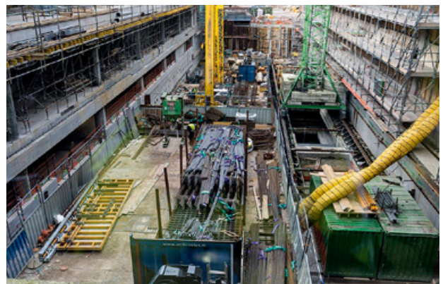
Bouw Poortgebouw (links op de foto) en Vredenburggarage (rechts)

Medio 2016 kunnen de eerste bezoekers parkeren in de nieuwe Vredenburggarage, die vijf ondergrondse verdiepingen en 1300 parkeerplaatsen heeft.