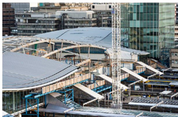
Laatste deel van de nieuwe Stationshal in aanbouw

Op Station Utrecht Centraal is de laatste fase van de verbouwing ingegaan. Het laatste deel van het dak wordt in de komende periode gebouwd. 's Avonds worden stalen spanten ingehesen die het nieuwe dak dragen. Overdag wordt dit verder afgewerkt. Het dak is in de loop van het voorjaar gereed. In de zomer kan de hal in zijn geheel in gebruik genomen worden.