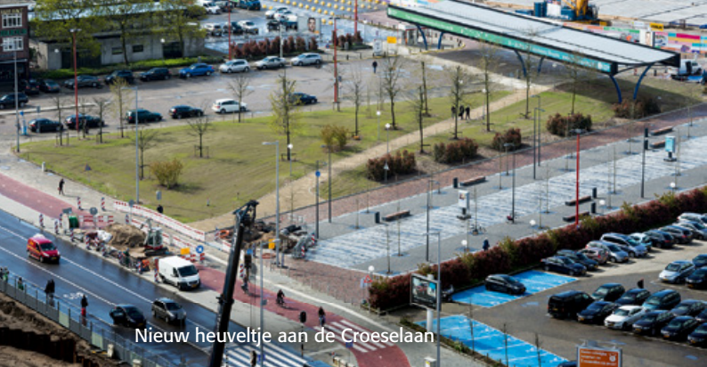
Nieuw heuveltje aan de Croeselaan