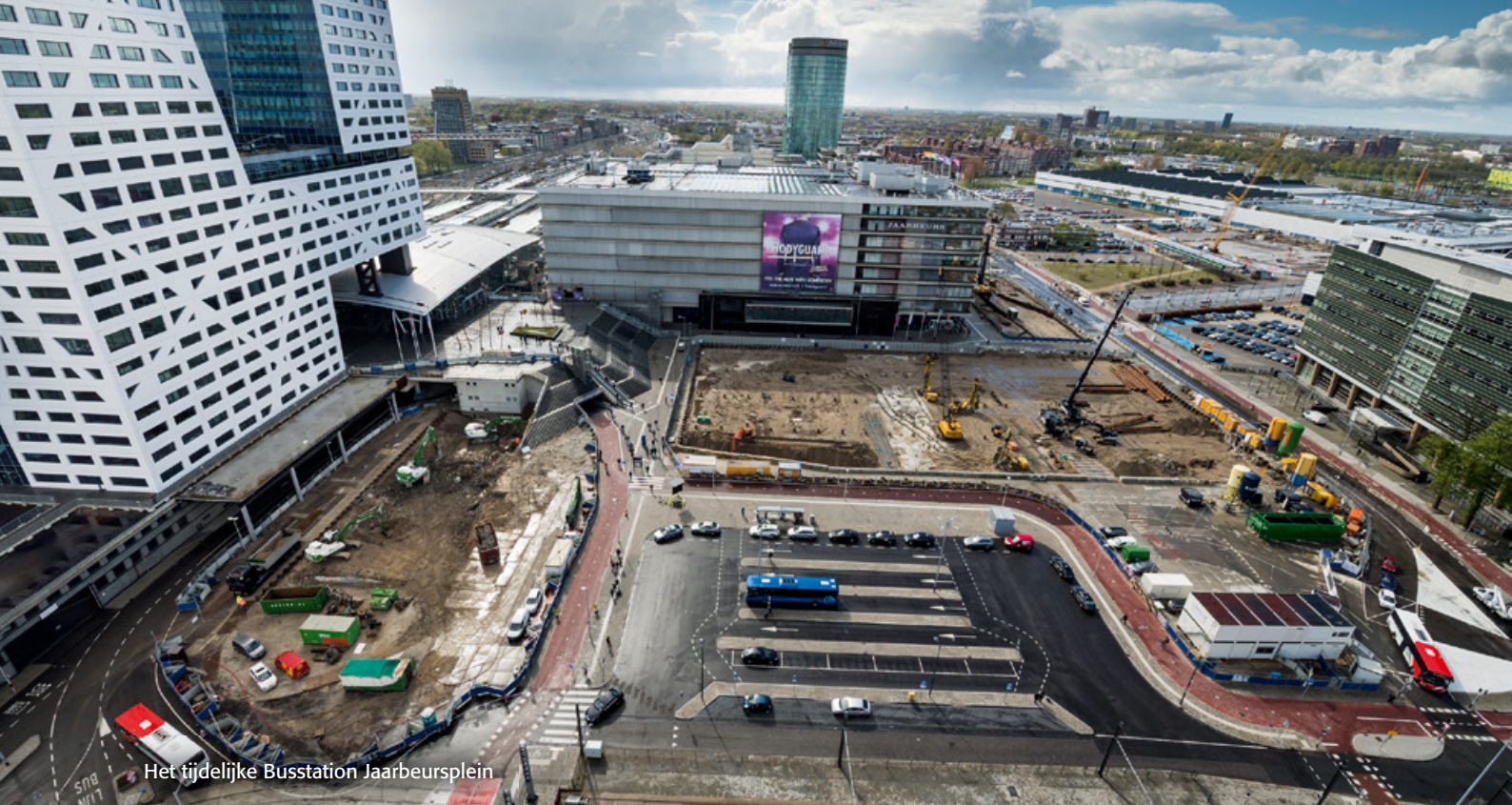
Het tijdelijke Busstation Jaarbeursplein