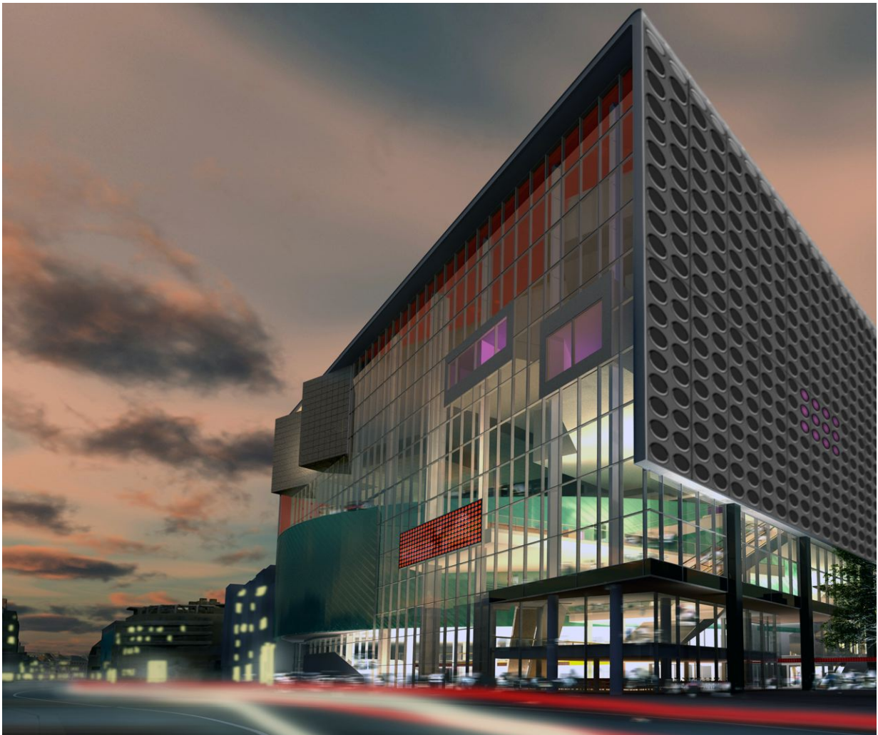
Muziekpaleis, zicht vanaf de busbaan

Het Muziekpaleis heeft in het onderzoek van Milieudefensie "rood" gescoord op het gebruik van 100 m 2 keroewing, aangezien deze behoort tot de familie van een bedreigde houtsoort. Keroewing wordt traditioneel veel toegepast voor podia vanwege het groot zelfherstellend vermogen. Omdat de vloer zeer intensief gebruikt wordt (met kans op beschadigingen, splinters), is voor dit materiaal gekozen. Daarnaast is deze houtsoort onderhoudsvriendelijk en daarmee gunstig voor de exploitatiekosten. Naar aanleiding van dit onderdeel van het rapport van Milieudefensie bezien wij in hoeverre deze houtsoort nog door een FSC gekeurd houtsoort kan worden vervangen. Heijmans Nederland heeft inmiddels bericht om in alle nieuwe projecten alleen nog duurzaam hout te gebruiken. Het besluit geldt ook voor projecten waarin dit niet is voorgeschreven. Het betreft hout met een FSC of PEFC (met uitzondering van MTCC) keurmerk.