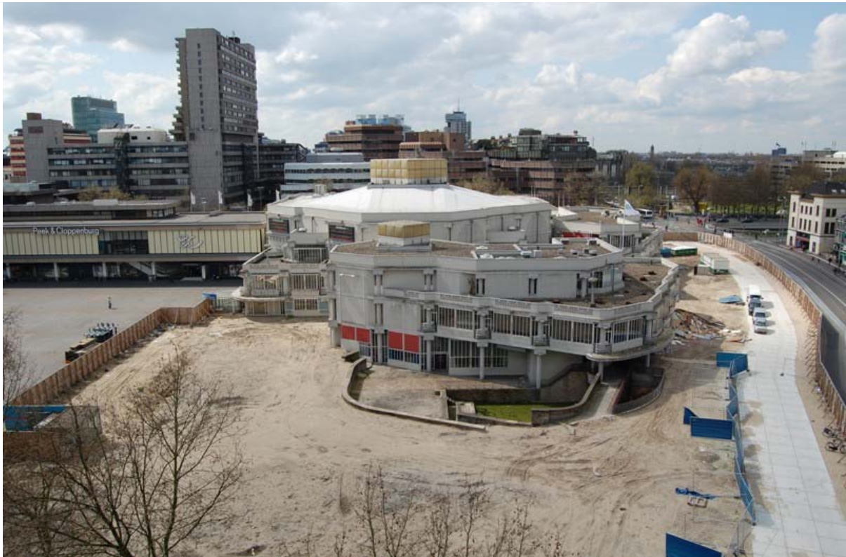
Muziekcentrum Vredenburg, april 2008

Dit hoofdstuk gaat in op de ontwikkelingen en aanpassingen die zich tijdens de uitvoering voordoen en zullen voordoen. Deze zaken kunnen zich bij ieder werk voordoen en zeker bij gecompliceerde werken als het Muziekpaleis. Bij gebouwontwikkelingen in dichtstedelijk gebied, worden er van te voren vooronderzoek gedaan en zo goed mogelijke aannames gepleegd. In tegenstelling tot bouwontwikkelingen in de wei, geldt dat dit terrein bovendien nog een bebouwde geschiedenis van eeuwen heeft. Minutieus onderzoek is vooraf niet mogelijk. De bouw van het Muziekpaleis is daar een prototypisch voorbeeld van.