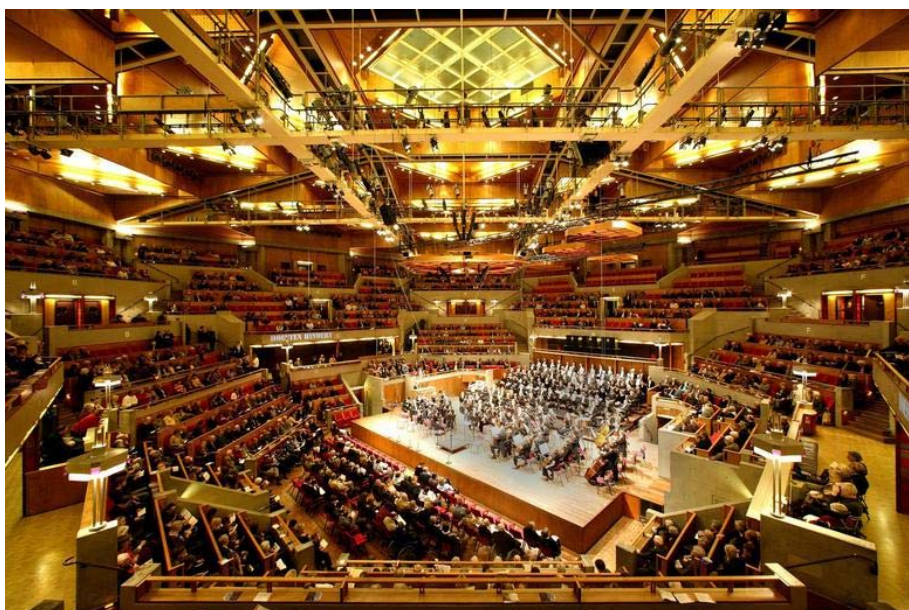
De grote zaal van het Muziekcentrum

De architect en aannemer zijn gevraagd een nieuwe opname te maken van de werkzaamheden en een bijbehorende herziene raming inclusief het strippen tot op het casco en het opnieuw opbouwen. In afwijking op eerdere vertrekpunten zou de toekomstige levensduur verlengd kunnen worden van 15 naar 40 jaar. Een en ander afhankelijk van inpassing in het krediet.