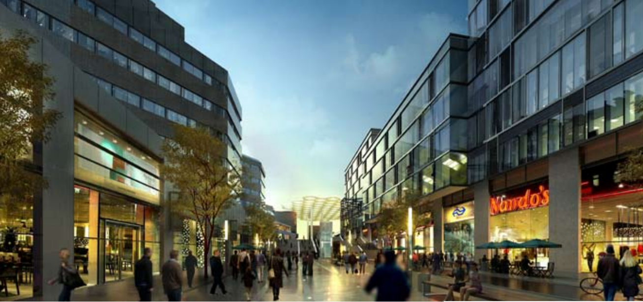
Stationsplein oost vanaf Smakkelaarsveld