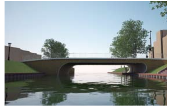
Paardenveldbrug vanaf Amsterdamsestraatweg

De (voorlopige) ontwerpen van de Paardenveld- en de Mariaplaatsbrug over de toekomstige Catharijnesingel zijn vastgesteld. Beide bruggen krijgen een zelfde vormgeving, alleen wordt de Mariaplaatsbrug iets breder.