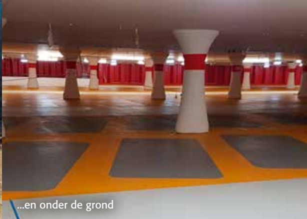
...en onder de grond