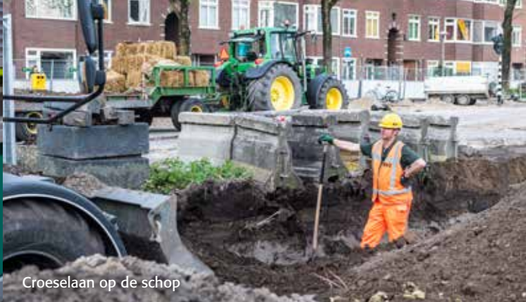
Croeselaan op de schop