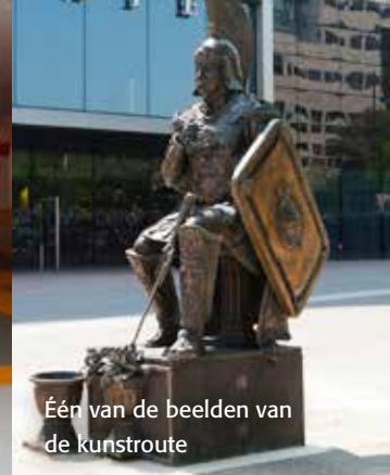
Één van de beelden van de kunstroute