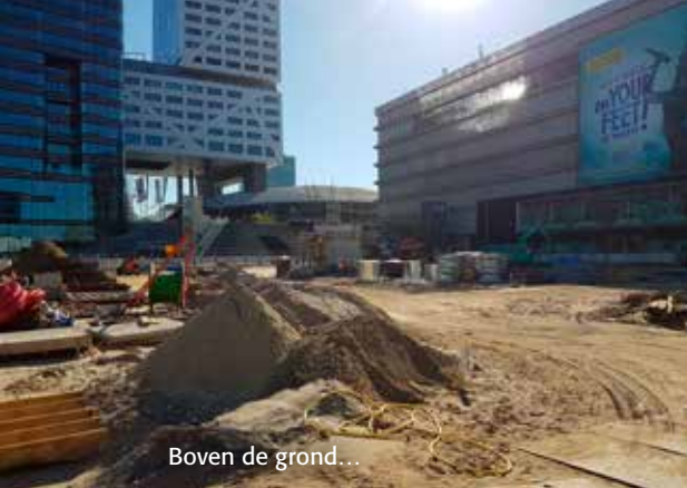
Boven de grond...