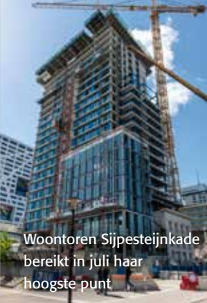
Woonstoren Sijpesteijnkade bereikt in juli haar hoogste punt