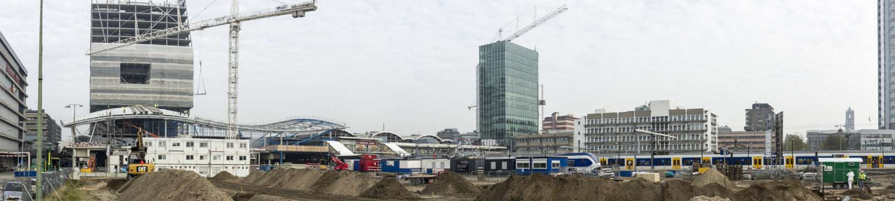
Utrecht Centraal met Stadskantoor gezien vanaf het nieuwe busstation west in aanbouw